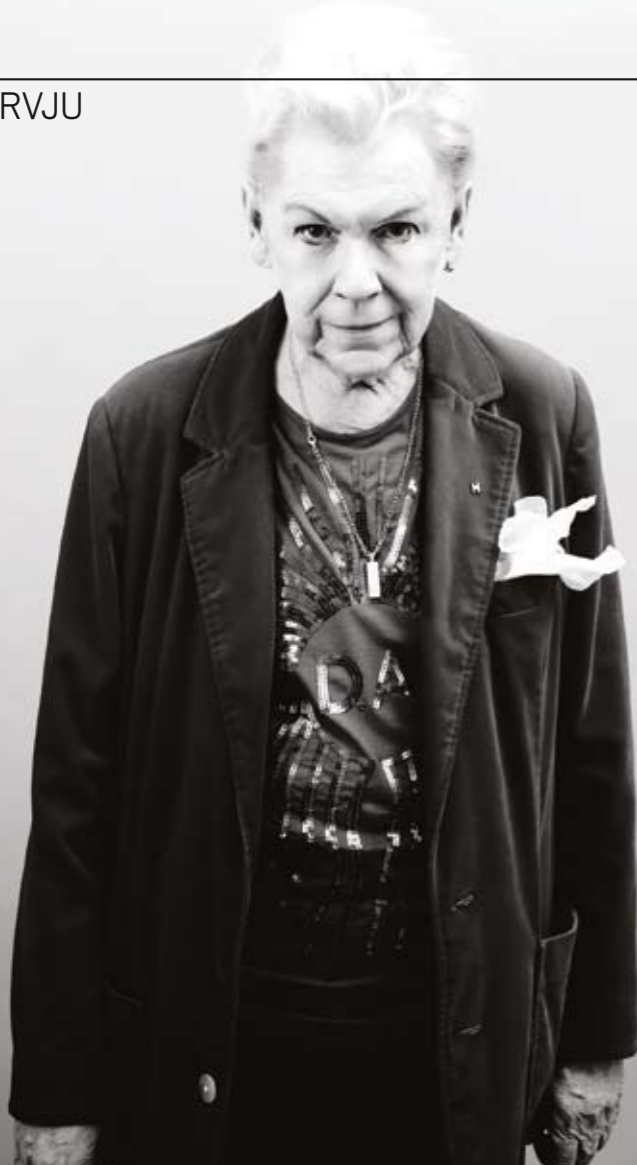
Orlando gjorde sitt första könsbyte redan på 60-talet.

– Jag fick kämpa hårt för att övertyga dem om att det går att skapa stor dramatik i den lilla, enkla formen.